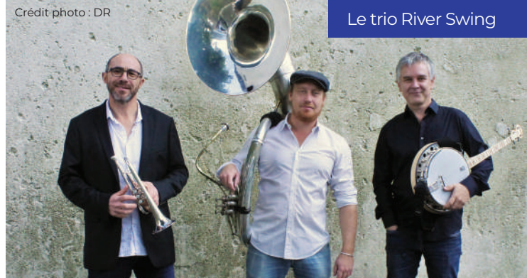
Le trio River Swing