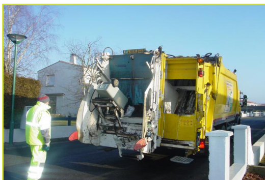
Collecte des ordures ménagères

Si l'utilisateur réalise ce tri, il ne reste que très peu de déchets dans le conteneur individuel. Celui-ci n'est d'ailleurs ramassé que tous les 15 jours.