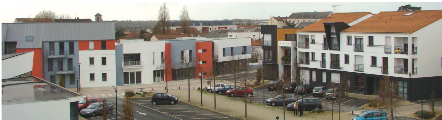
Le quartier du Mail compte aujourd'hui une centaine de logements au cœur de la ville

Ces travaux s'inscrivent également dans le cadre de la construction du Théâtre de Thalie et devraient s'achever en mai 2010.