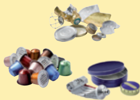
Petits emballages métalliques