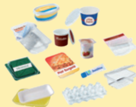
Pots, boîtes et barquettes en plastique