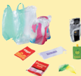
Sacs, sachets et films en plastique