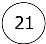
Numéro de sentier

Tous les sentiers de randonnées de Terres de Montaignu sont balisés en jaune et numérotés :