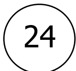
Numéro de sentier

Tous les sentiers de randonnées de Terres de Montaigu sont balisés en jaune et numérotés :